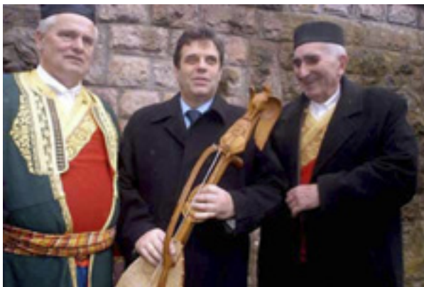
Војислав Коштуница и гуслари

више не пева о последњем рату, него да се ту изводи само репертоар класичне епике. Враћене у контекст славне прошлости, оне могу без проблема да се нађу у близини нових угледника, на пример, у рукама Војислава Коштунице, на прослави дана српске државности у Орашцу 15. фебруара 2006.