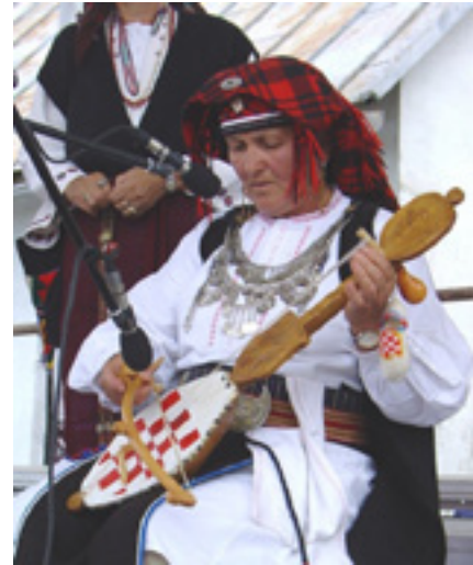
Гусларка из Дувна. Удбине, 15. септембар 2007.

јавља се на интернету под псеудонимом Имота Динароид. Као доказ да Дубровник има хрватску народну душу, он је изнео податке о томе да се у том граду већ вековима свирају хрватске гусле, а то илустровао овом сликом.