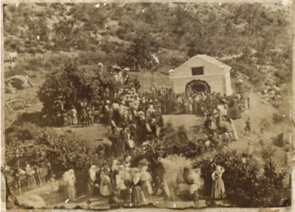
Освећење шуматовачке Цркве св. Тројице, 1888, COBISS.SR-ID:173603852