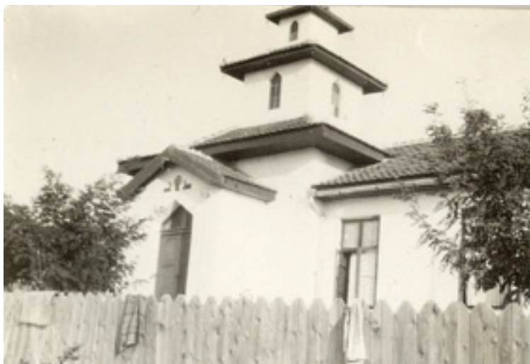
Будистички храм у Београду, COBISS.SR-ID: 176995852