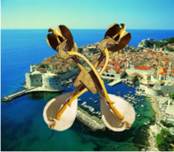
Гусле и Дубровник