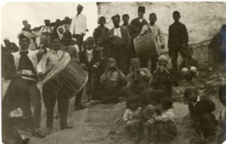
Зурлаши и тупанџије на свечаности сунетисања у циганској мали, 1930, COBISS.SR-ID:178125324