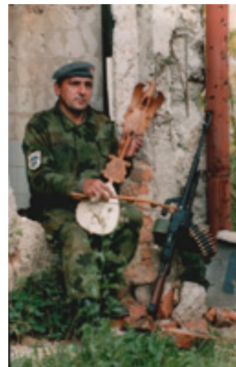
Гусле и митраљез. Неџарићи, 1995.

Многи црногорски гуслари после ратова у Хрватској и Босни, и почетка распада Југославије, настојали да дају свој допринос опстанку заједничке