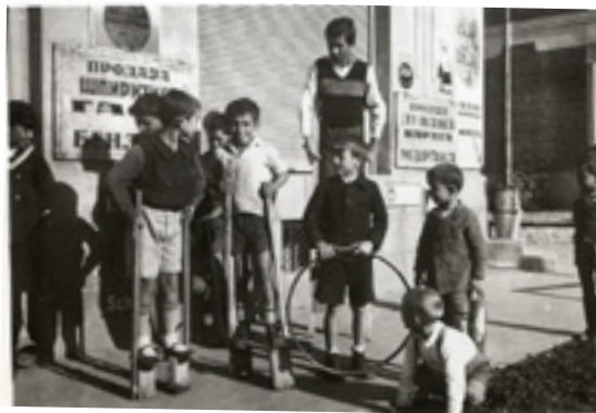
Деца на гигаљкама, 1930